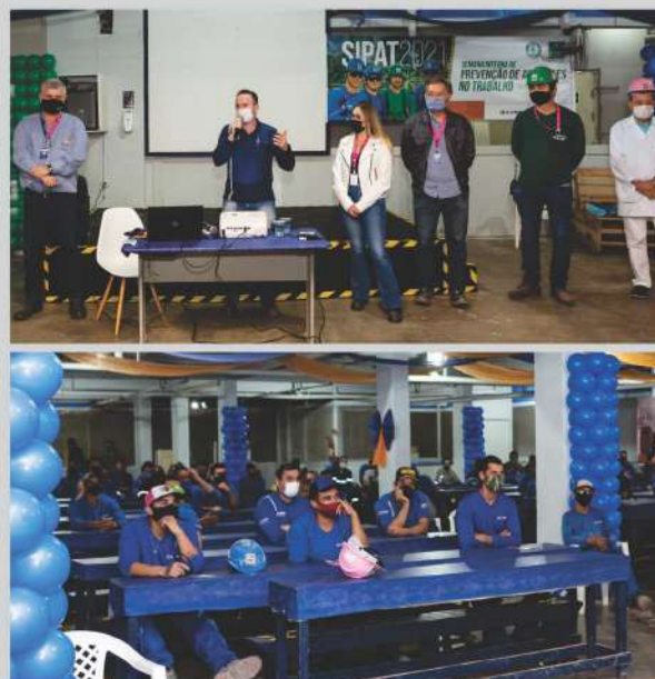
Lideranças e colaboradores durante a Sipat 2021.

Os conteúdos foram ministrados de forma presencial, por meio de palestras e vídeos: “Tivemos um resultado muito positivo com mais essa Sipat, reforçando a importância de trabalharmos em um ambiente humanizado e seguro”, conclui o diretor. ■