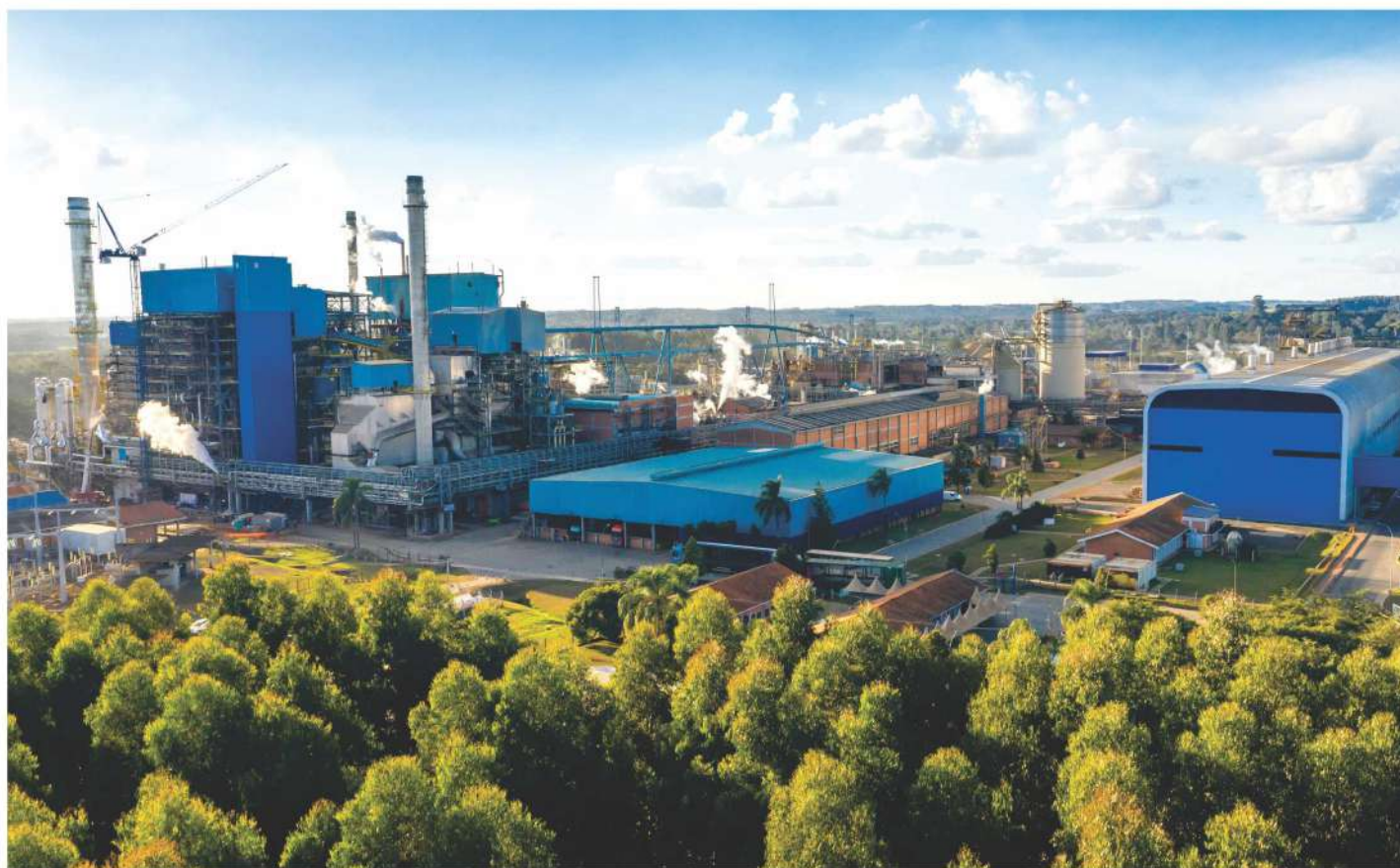
Unidade de papelão ondulado em Três Barras, Santa Catarina.