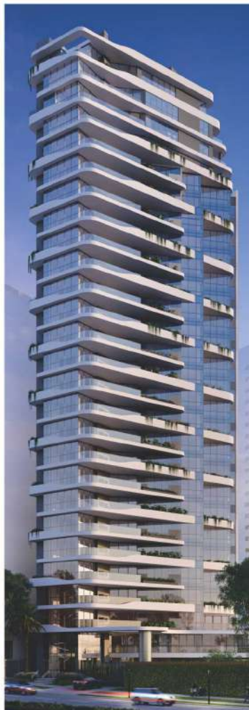
Epic - Curitiba