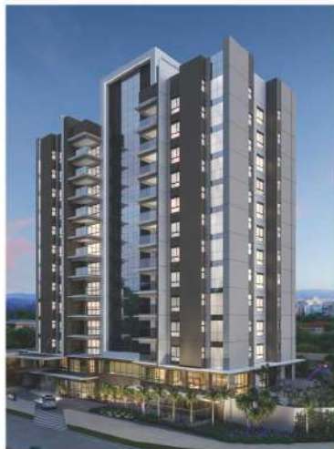
Harmonie - Campinas