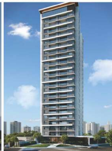
Casa Palhano - Londrina