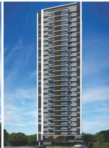
Soul - Maringá