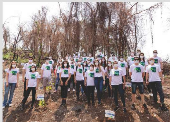
Voluntários do Instituto plantam árvores na bacia do Rio Tibagi.