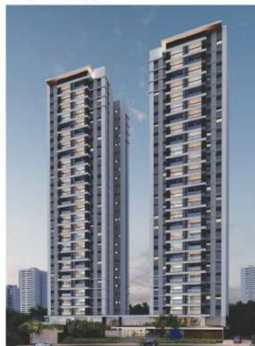
Artsy - Londrina