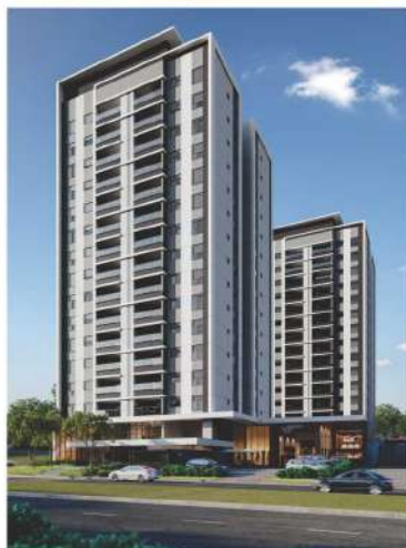
Terraza Di Rimini - Londrina