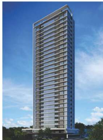
Sky - Maringá