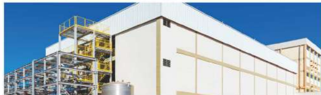
Porto Alegre Airport, Supermercado Cidade Canção e Ajinomoto são algumas das obras industriais da A.Yoshii em 2021.