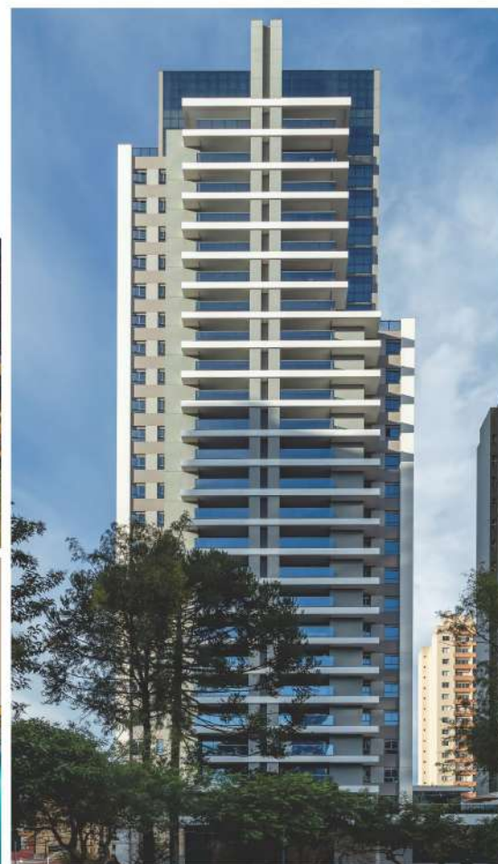
Fachada e algumas áreas comuns do Artsy, em Curitiba.