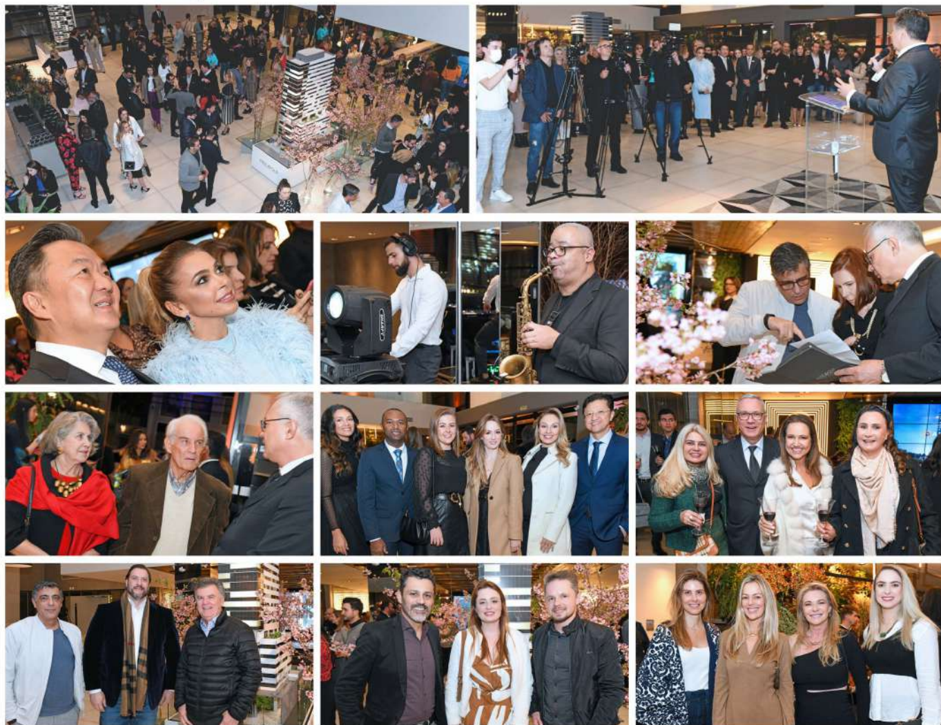
Evento de lançamento atrai empresas e profissionais em busca de um espaço comercial de alto padrão no coração de Curitiba.