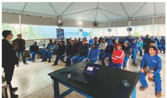
Reuniões do INOVA.YOSHII realizadas em diferentes cidades em que o Grupo A.Yoshii está presente.