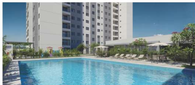
Brisas Bella Città, em Campinas.