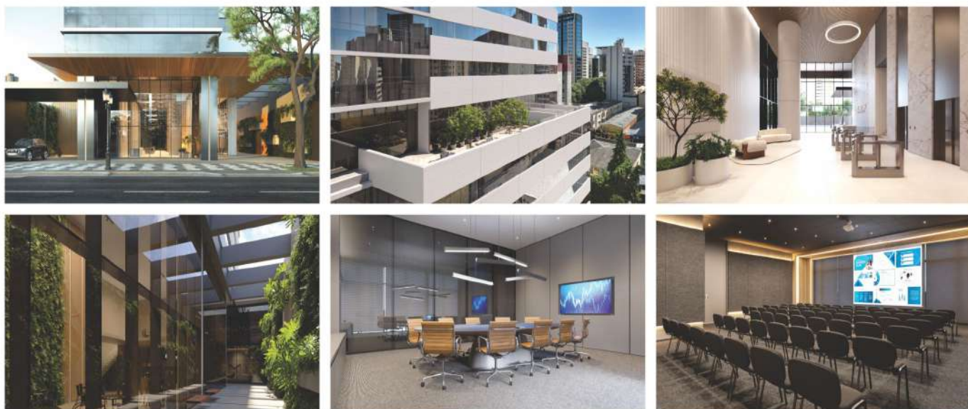
Áreas comuns do Endeavour, como auditório, hall de entrada, sala de reuniões e terraço com área verde.